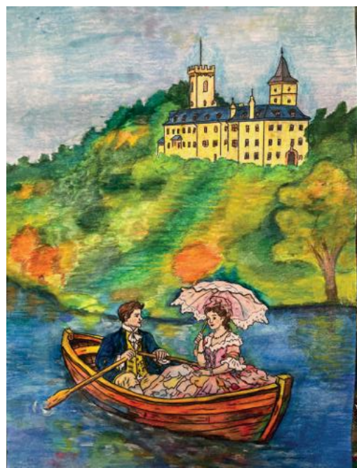
Romantická vyjížďka komtesy B. po Vltavě, autorka obrázků Jana Janičková, 2026